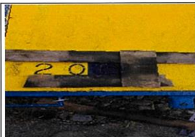
薄くなったトロ番号も書き直し