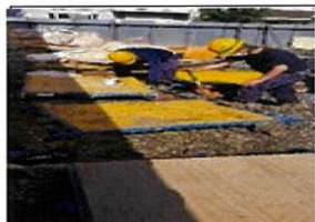
今回はトロのブレーキ調整をやってみた