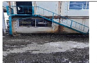
地盤をならして完成