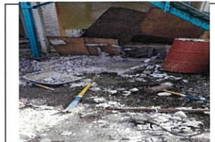
なるべく細かく砕いています