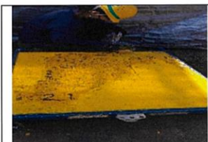
塗色もしっかりと行いました