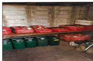
棚を作って綺麗に並べました