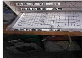
員数表の残りを確認