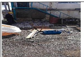
油庫破壊してます