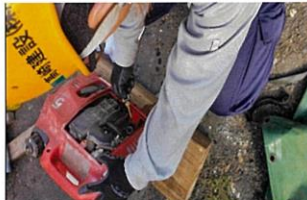
100Vの円エンジンが調子悪い