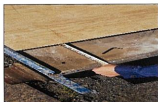
板がはがれているところは張り替えた