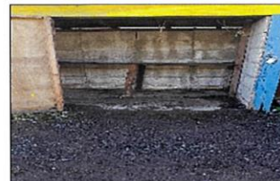
空になった状態。中身はガス庫に移動